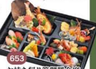
653 31.5×44cm 5,500円(税別) お持ち帰り箱御膳会席

※表示価格には消費税は含まれておりません。 ※ご希望により生物は、別のお料理に変更させていただきます。 パック以外の商品につきましては、お膳・容器は回収させていただきます。