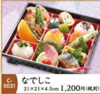
C-0031 なでしこ 21×21×4.5cm 1,200円(税別)