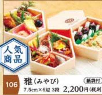
106 雅(みやび) 紙袋付 7.5cm×6辺 3段 2,200円(税別)