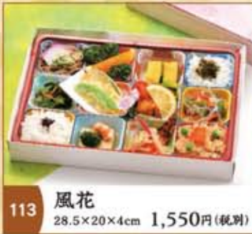
113 風花 28.5×20×4cm 1,550円(税別)