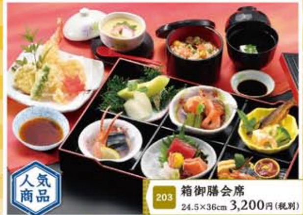
203 箱御膳会席 24.5×36cm 3,200円(税別)