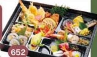
652 28×38cm 4,400円(税別) お持ち帰り箱御膳会席