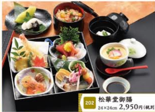
202 松華堂御膳 24×24cm 2,950円(税別)