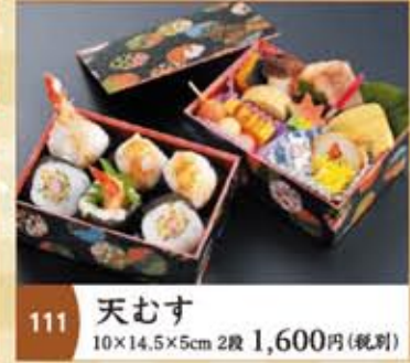
111 天むす 10×14.5×5cm 2段 1,600円(税別)