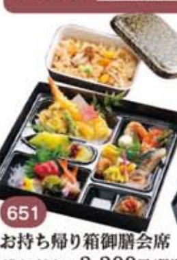
651 27.1×30.2cm 3,300円(税別) お持ち帰り箱御膳会席