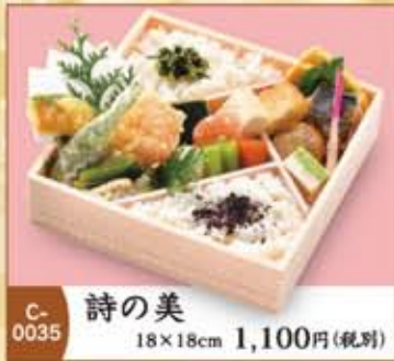
C-0035 詩の美 18×18cm 1,100円(税別)