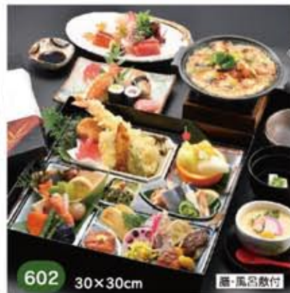
602 30×30cm 膳・風呂敷付 おもてなし箱御膳会席 5,600円(税別)