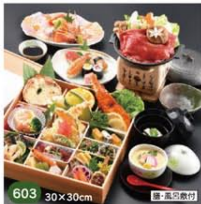
603 30×30cm 膳・風呂敷付 おもてなし箱御膳会席 6,500円(税別)