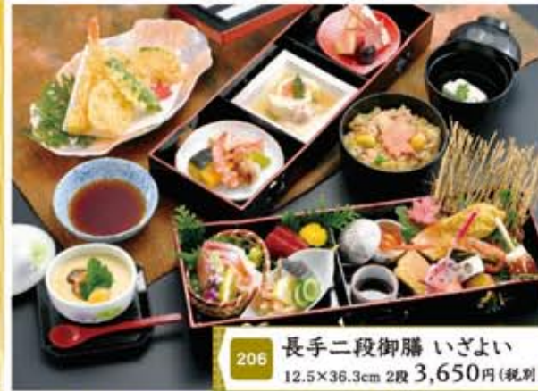
206 長手二段御膳 いざよい 12.5×36.3cm 2段 3,650円(税別)